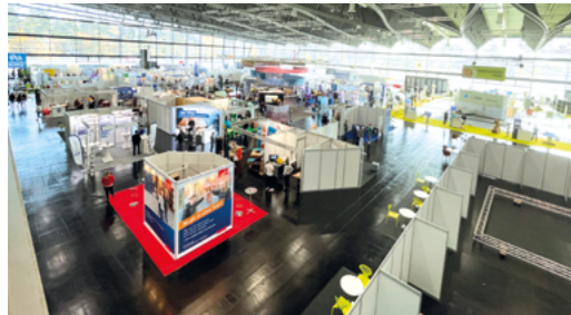
Blick auf den Innovationspark