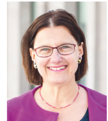
Fotocredit: StMAS; Max Hörath Design